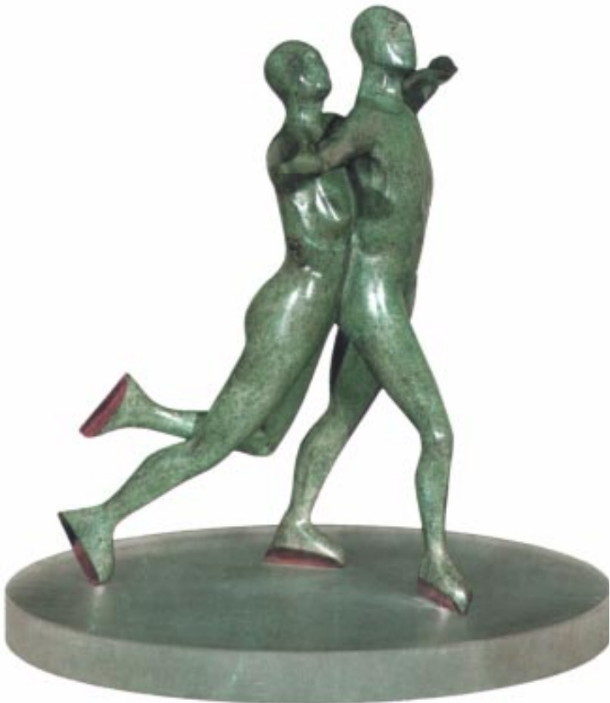
« Danse sur glace » du sculpteur britannique Allwin Davies dont l'œuvre est présentée dans ce numéro.